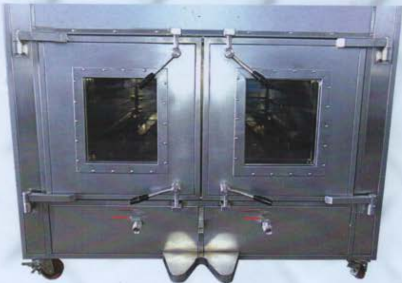
Frontale forno con camera da 150 x 250 cm., con porte con doppio vetro temperato (optional). In evidenza le 4 chiusure.