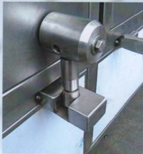
Particolare della chiusura delle porte ad alta resistenza.