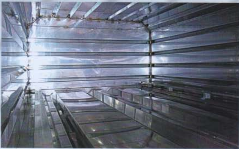
Camera interna in acciaio sagomato, 2 mm di spessore.