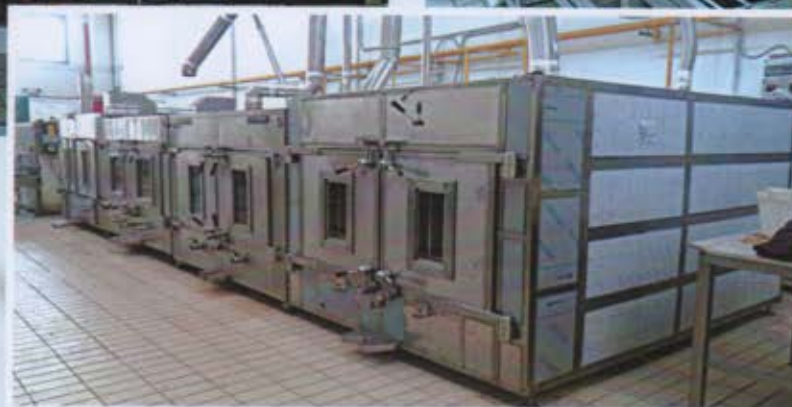
Laboratorio cottura carni presso azienda marchigiana