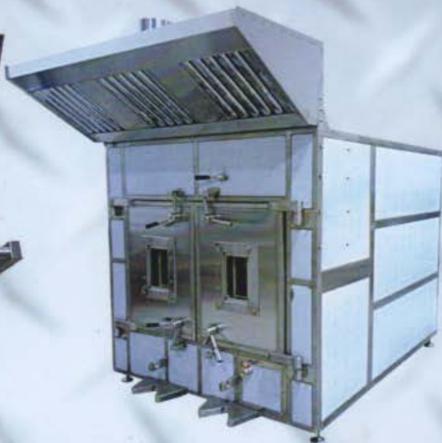
Forno doppio, completo di cappa, modello 2 porte.