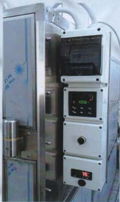
Particolare del quadro elettrico stagno con termoregolatore, accensione temporizzata, svariati programmi di cottura e sonda al cuore.