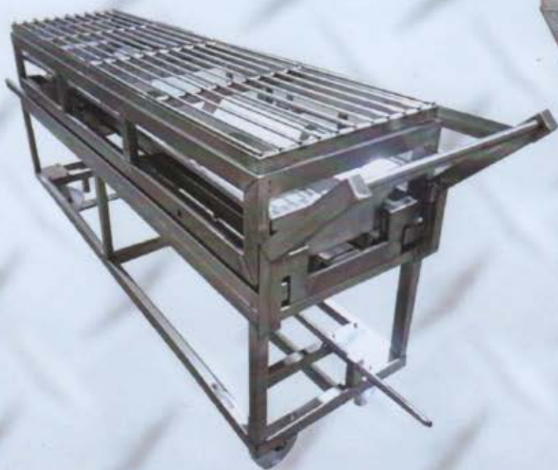
Carrello completo per una porcbetta.