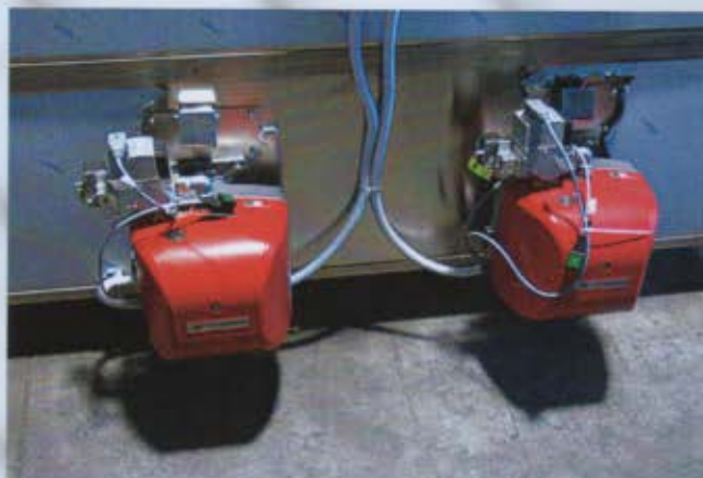
Bruciatore ad aria soffiata (marca UNIGIG, ditta leader italiana per la fabbrica di bruciatori anche per altre marche) montato sul retro del forno. Camera di combustione stagna. Dotazione, 1 bruciatore per forno singolo e doppio, 2 bruciatori per forno MAXI.