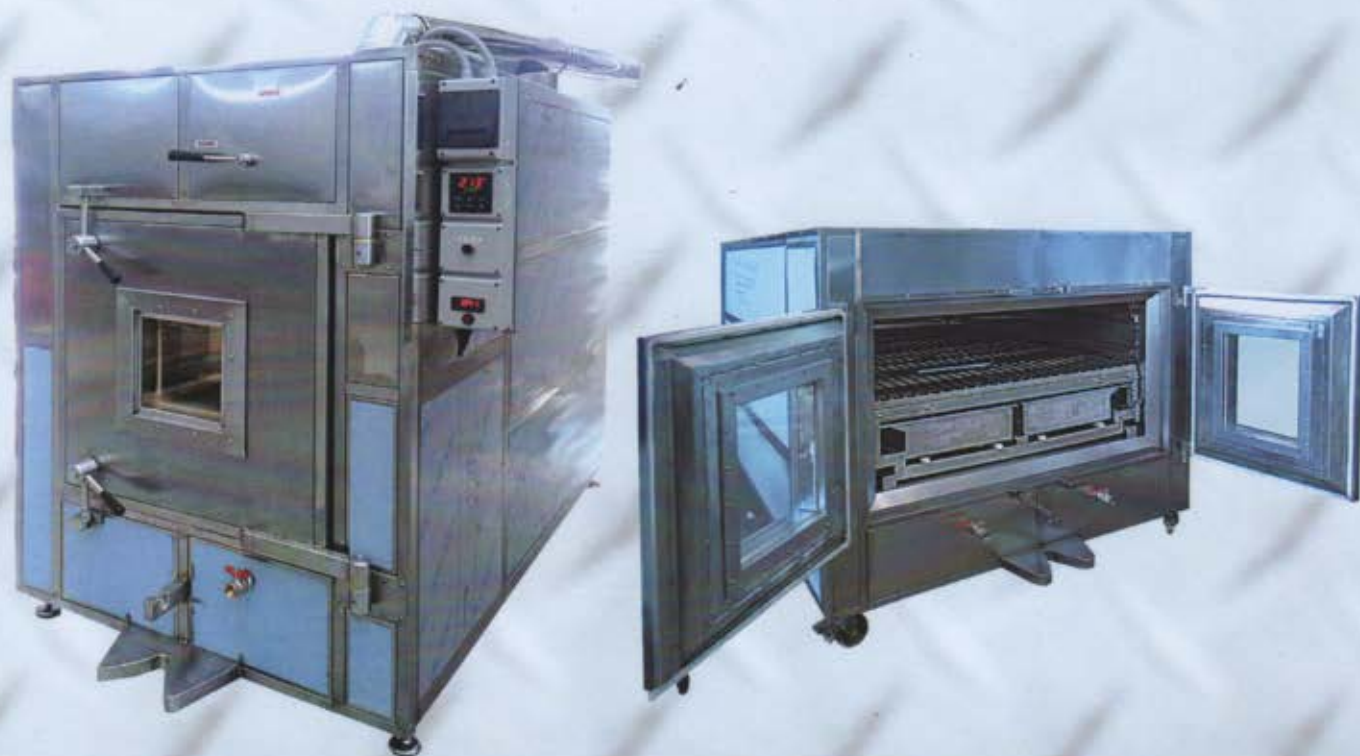
Forno camera 68 x 195 x 70h. (Oblò in vetro - optional)

Misure camera: cm. 68 x 195 x 70h cm. 110 x 195 x 70h cm. 150 x 250 x 70h