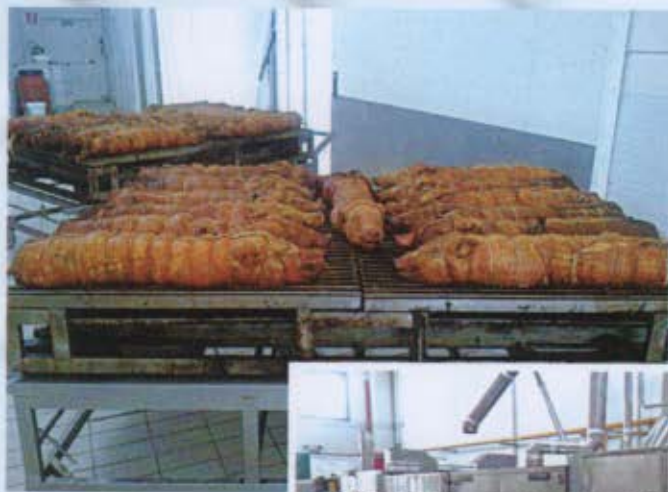
Dieci porchette da 40 kg., pronte per la vendita, presso i locali di un cliente marchigiano.