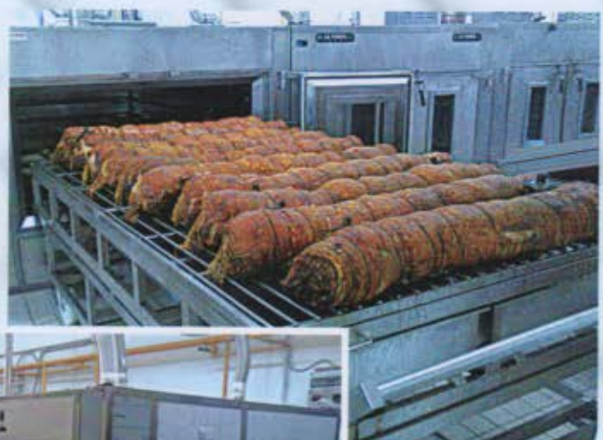
Forno carico di porchette nei locali di un cliente.