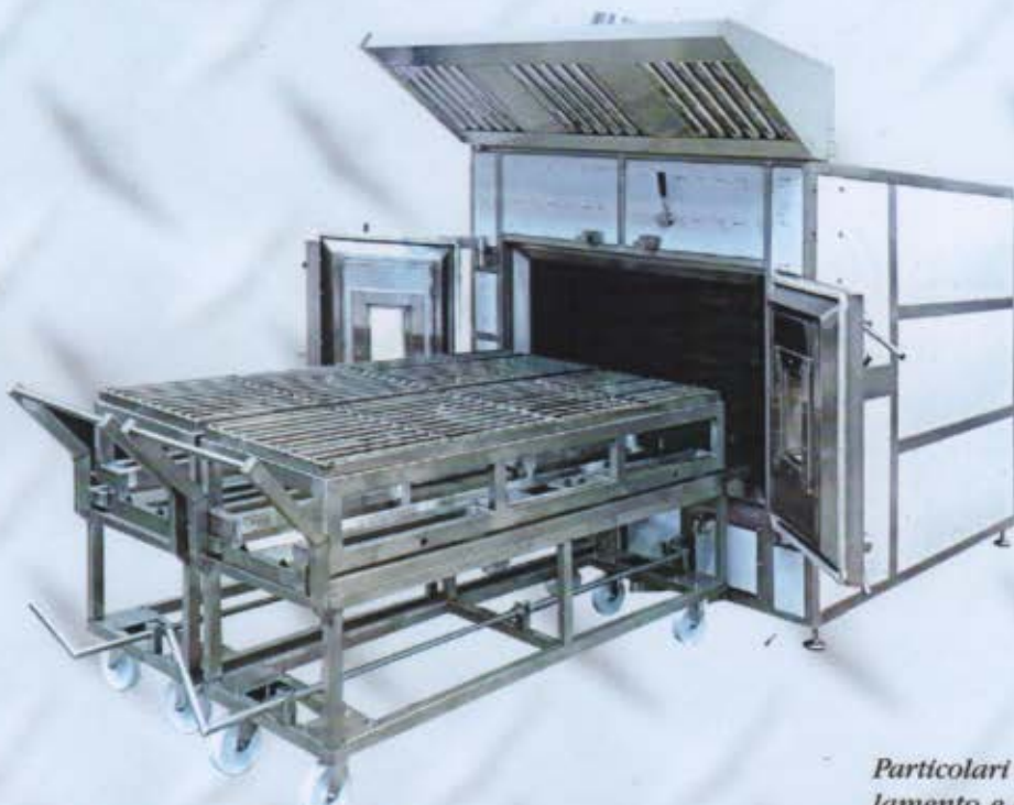
Forno doppio con carrelli singoli.