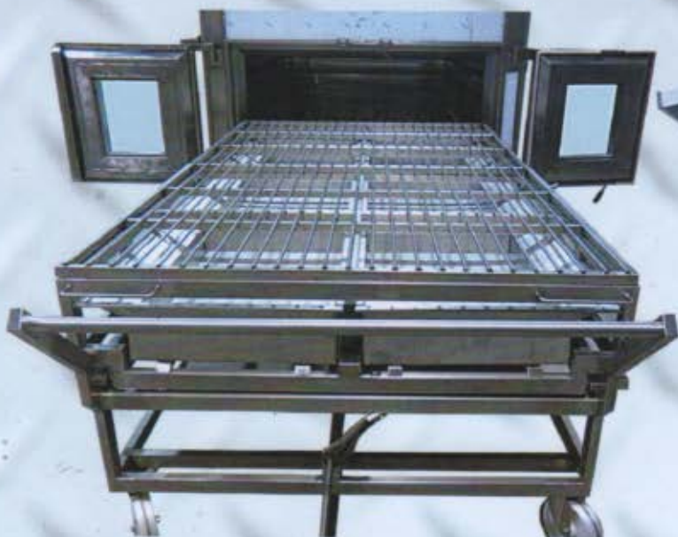
Particolare del carrello unico, forno con camera da 150 cm.. Carrello interno ed esterno. Apertura porte con angolo di 120°.