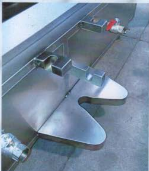
Particolare dell'aggancio al forno dei carrelli. In evidenza saracinesca da 1" per scarico acque di lavaggio.