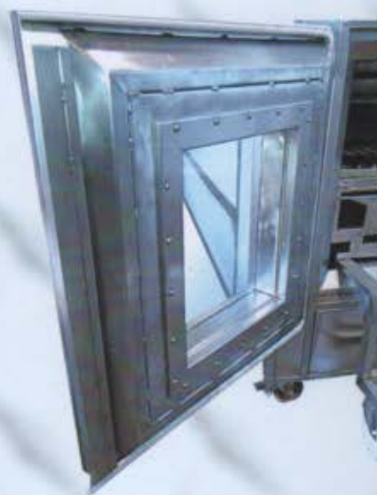
Particolari delle parti di chiusura con cm. 10 di isolamento e guarnizioni per alte temperature: peso porta kg. 50.