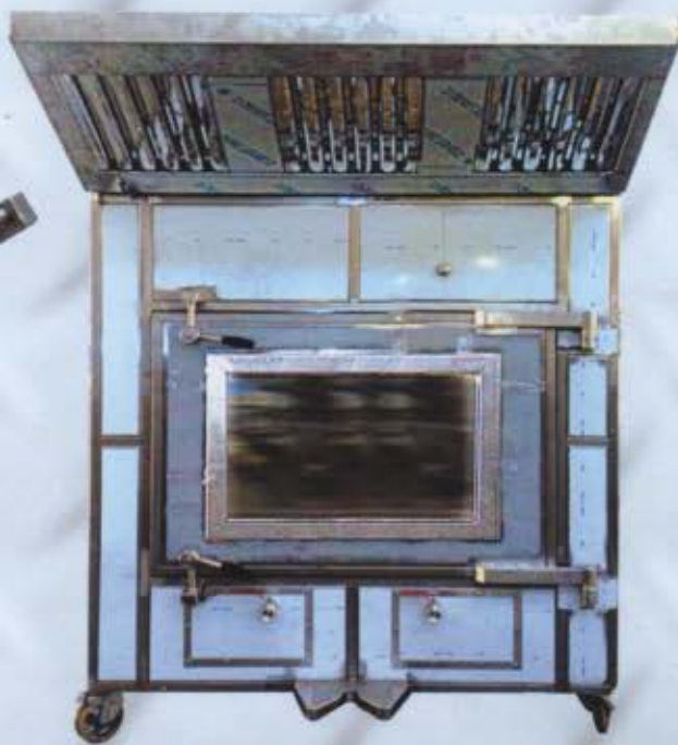
Particolare del forno con camera da 110 cm. con porta singola e cappa con filtri a labirinto.